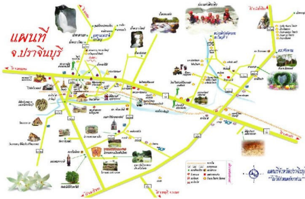
อยู่ในเขตสระบุรี

จังหวัดปราจีนบุรี เป็นดินแดนที่มีความเจริญรุ่งเรืองมาตั้งแต่สมัยทวารวดี จนถึงสมัยลพบุรี ประมาณ ๔๐๐ ปีก่อน ปรากฏหลักฐานเป็นซากเมืองโบราณที่เรียกว่า “เมืองศรีมโหสถ” ที่ตำบลโคกปึก อำเภอศรีมโหสถ และทางด้านทิศตะวันออกของเมืองศรีมโหสถที่บริเวณบ้านโคก อำเภอศรีมโหสถ มีชุมชนโบราณที่มีอายุร่วมสมัยเดียวกันกับเมืองศรีมโหสถอีกด้วย ซึ่งเหมาะแก่การท่องเที่ยวเชิงประวัติศาสตร์ นอกจากนี้ยังมีแหล่งท่องเที่ยวที่สำคัญทางธรรมชาติ ได้แก่ อุทยานแห่งชาติ ได้แก่ อุทยานแห่งชาติเขาใหญ่ อุทยานแห่งชาติปางสีดา และ อุทยานแห่งชาติทับลาน ซึ่งเป็นแหล่งโอโซนที่เจ็ดของโลก ปัจจุบันองค์การสหประชาชาติได้ประกาศให้เป็นผืนป่ามรดกโลก รวมถึง